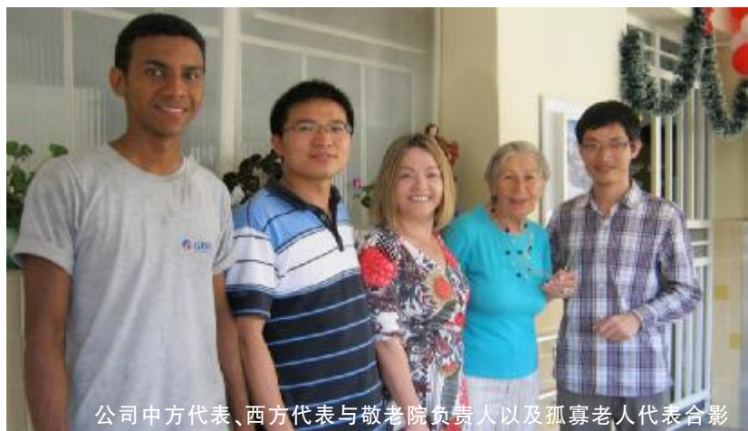
公司中方代表、西方代表与敬老院负责人以及孤寡老人代表合影

圣诞前夕，巴西联合电器SC分公司以一种特别的方式“送温暖爱心传播活动”来庆圣诞，迎新年。