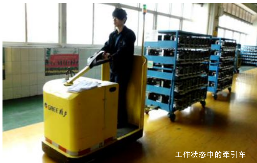
工作状态中的牵引车