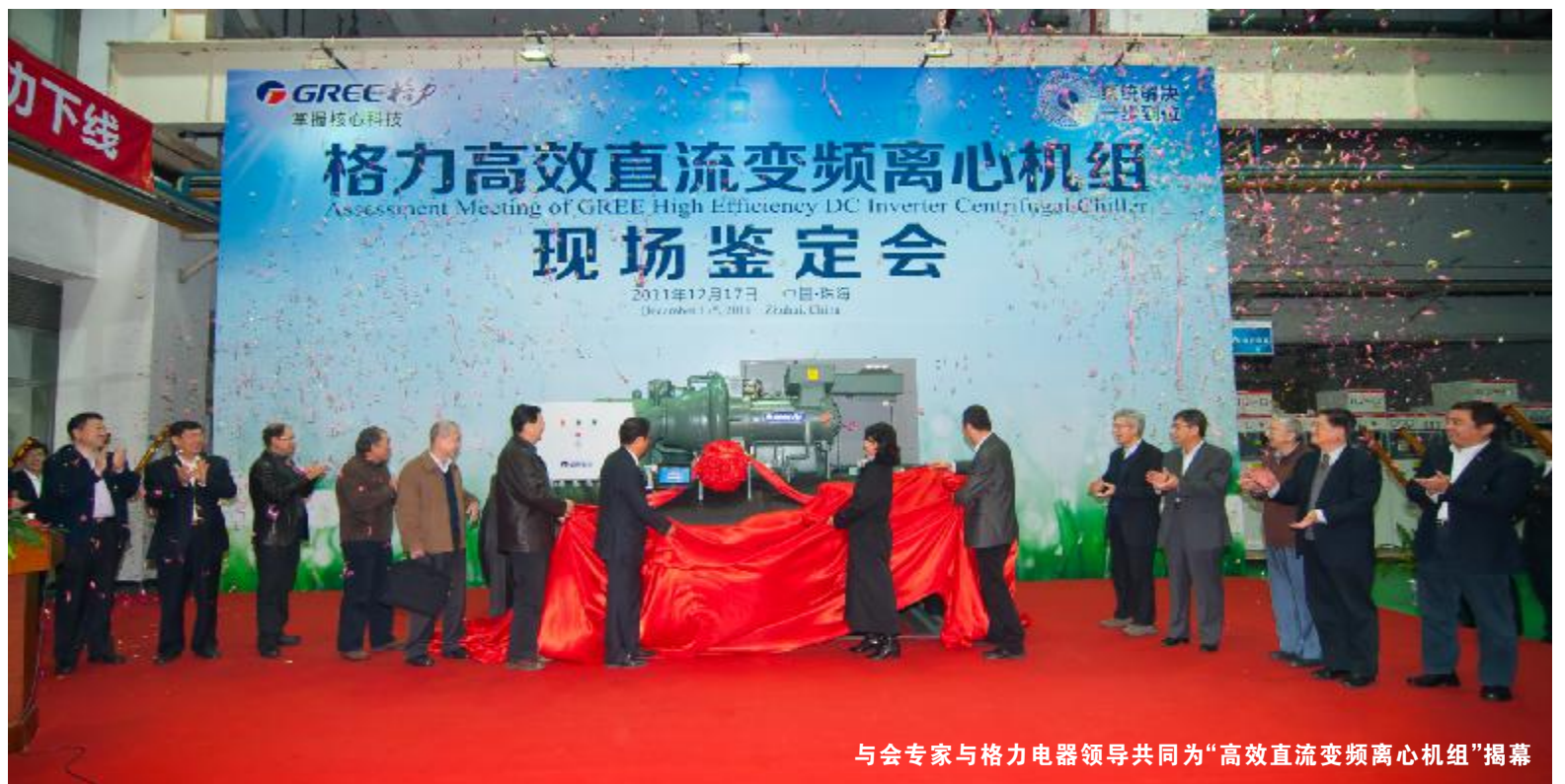
与会专家与格力电器领导共同为“高效直流变频离心机组”揭幕