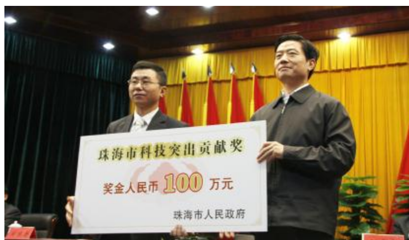
珠海市委书记甘霖向格力电器颁发“珠海市科技突出贡献奖”

坚持科技领军、锐意创新的格力，获得了市场的一致认可。在代表空调主流的变频空调领域上，格力成为了消费者的首选：日前发布的变频空调市场报告显示，今年10月份，我国变频空调的销售总量为